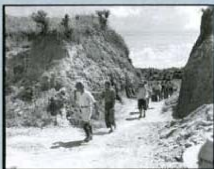
入所者による戦後復興 1945年