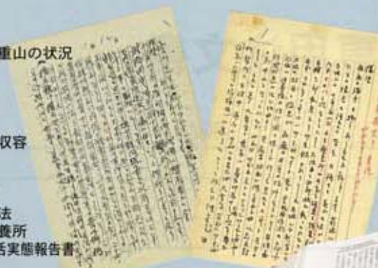
青木恵哉書簡 1932年～1935年